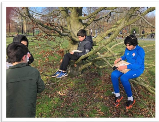
Na een voetbaltraining hebben de kinderen een keer samen pizza gegeten.

De kinderen zijn op deze manier lekker actief en buiten bezig. En daarbij worden hun sociale contacten op peil gehouden.